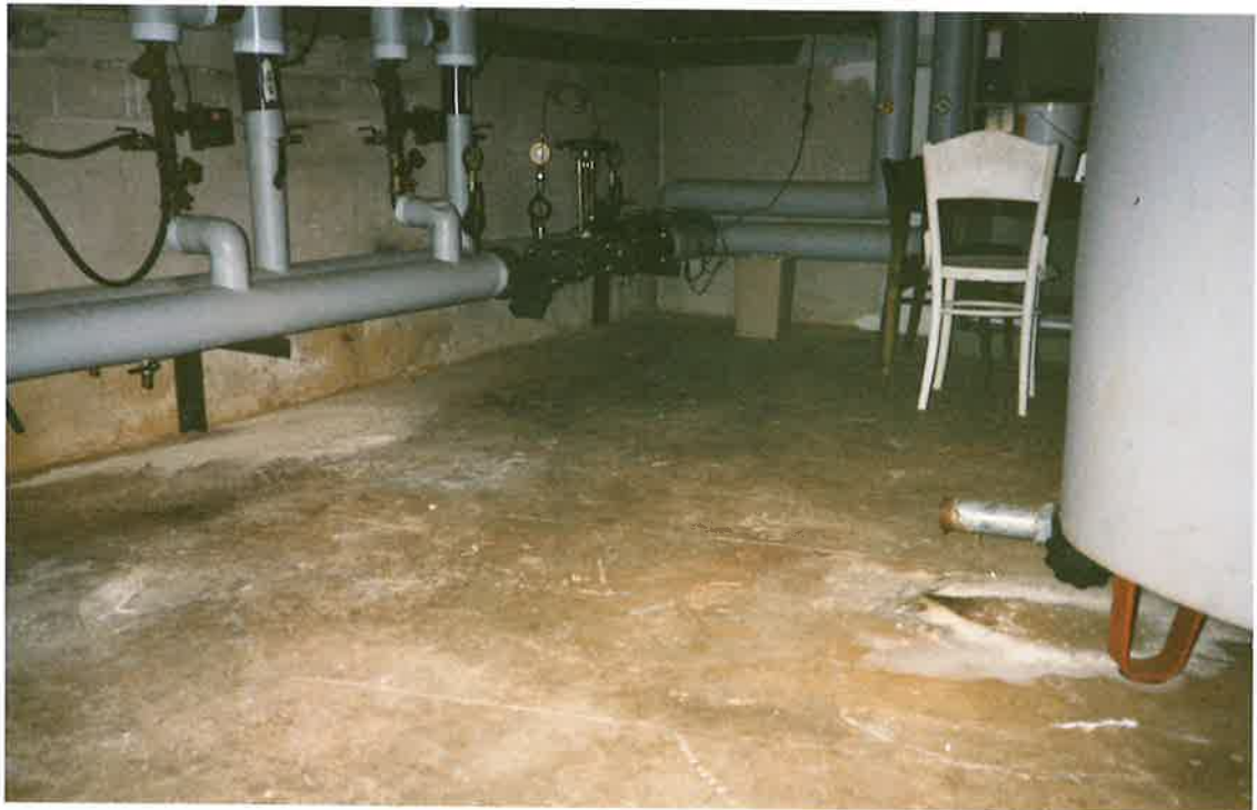
Den lysegule kalk måtte fejes sammen og skovles væk

Efter få måneders testperiode med SOLVIN® magnetisk vandbehandling, væltede opløst kalk ud af varmtvandsbeholderen, når den en gang om måneden blev slæmmet ud